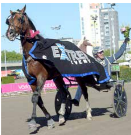
Night Brodde och Conrad Lugauer vann Elitsprintern på Solvalla.

Breeders' Crown Treåriga h/v, Halmstad 17/5 Felix Orlando - Per Nordström