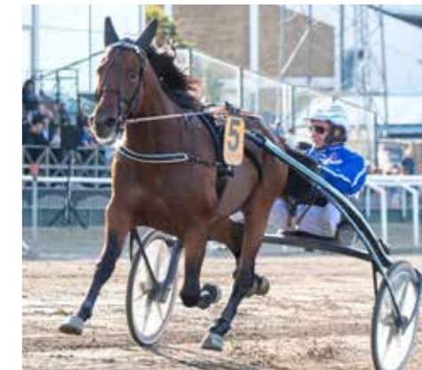
Calgary Games vann Michelsens Bil - Svenskt Travderby i stor stil.