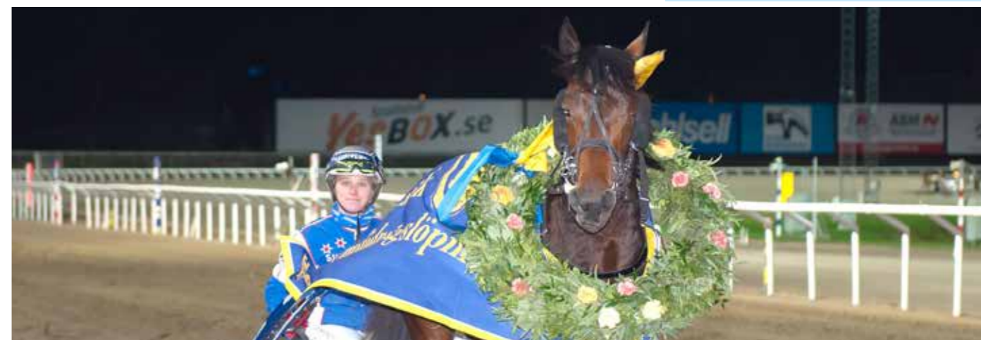
Omslaget: En trevlig dag på travskolan.