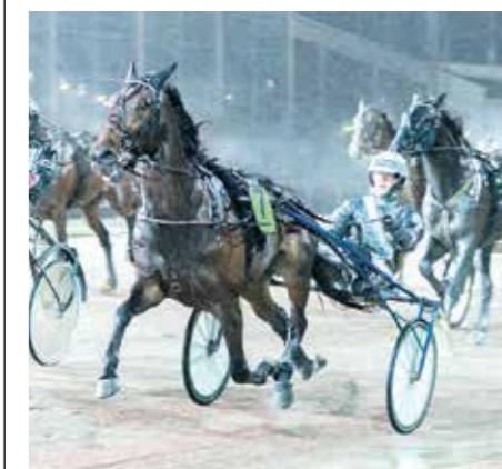
Global Takeover och Christoffer Eriksson vann ett extra Klass II-försök under hösten.

Kriterie-Revanschen, Solvalla 6/12 Calle Crown – Björn Goop (Tomas Malmqvist)