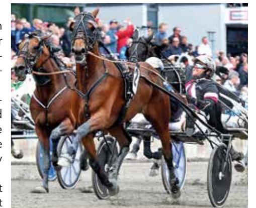
Dante Boko blev vinstrikaste Jägersrohäst 2017 med närmare två miljoner kronor insprunget.

Mycket av 2018 handlar såklart om Pokalåret och vi kommer ganska säkert ha runt 10 procents höjning av prispengarna mot 2017 vilket ju är riktigt bra. Sportsligt hoppas vi förstås att vårt starka himmalag fortsätter sina framgångar runt om i världen. På hemmaplan vill vi ju också se himmalaget kämpa om topplaceringarna i våra stora lopp, inget höjer stämningen på publikplats som en stor hemmaseger!