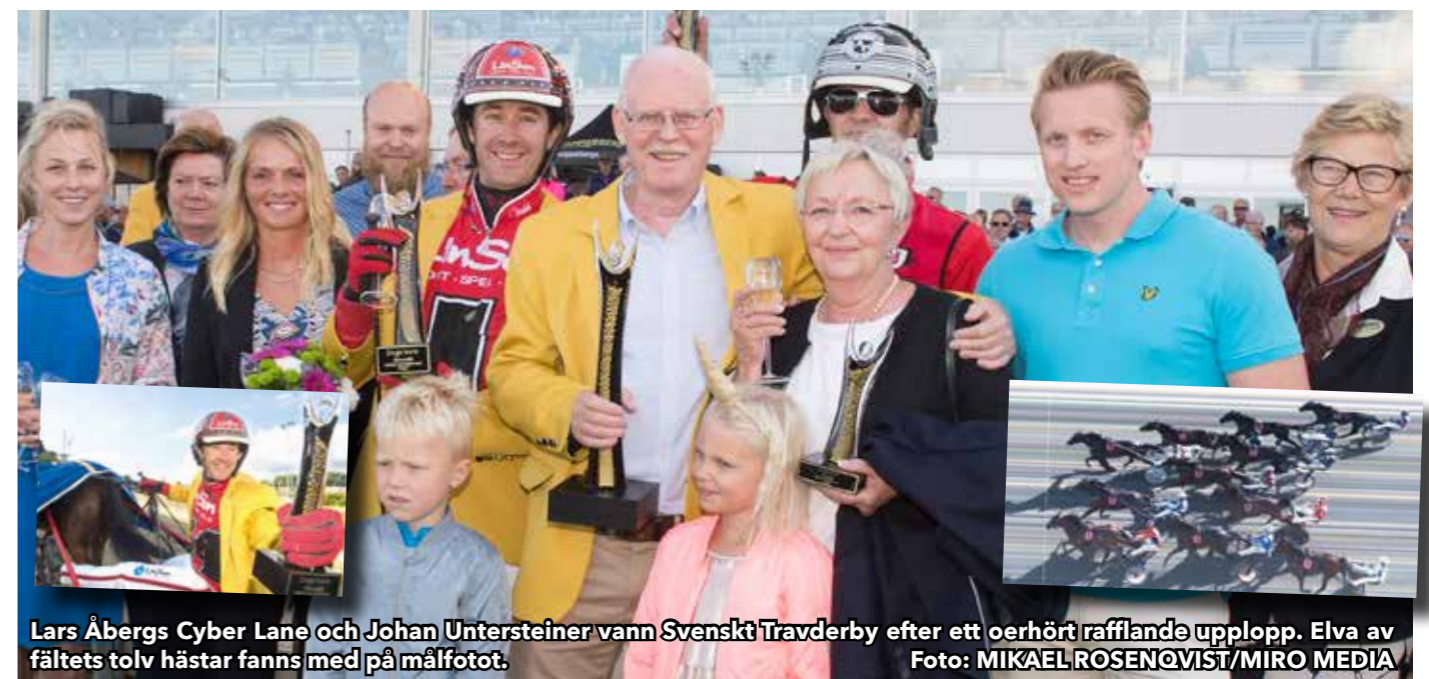
Lars Åbergs Cyber Lane och Johan Untersteiner vann Svenskt Travderby efter ett oerhört rafflande upplöpp. Elva av fältets tolv hästar fanns med på målfotot.